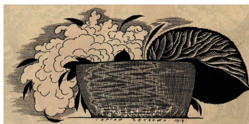
Рис.3 Віньетка у кінці сторінки

Ще є прикрасою для початку чи кінця тексту невеликий малюнок чи орнамент, який називають віньеткою (2). Зазвичай сюжетом для вінєток є рослинні мотиви (часто фантастичного й казкового змісту), абстрактні зображення, рідше — зображення людей і тварин. На відміну від ілюстрацій, віньетка жодним чином не повинна відволікати увагу читача від тексту, її завдання — надання книзі художньо-оформленого вигляду. Кажучи сучасною мовою, віньетка — елемент дизайну (рис.3).