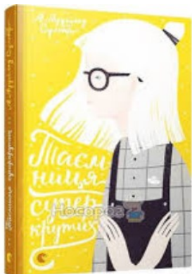
Рис.3 Приклад дизайну сучасної обкладинки

Також найперше що ми бачимо у книзі — це її обкладинка. Обкладинку використовують для надання книзі яркого кольору, декору, але при цьому зберігати та надавати точну характеристику книзі. Бо наприклад, якщо книга є художнього напрямку на тематику жахів, то добрі малюнки будуть псувати перше враження від книги. Тому можна зробити висновок що обкладинка є презентацією книги для читача.(Рис.4)