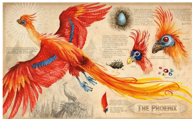
Рис.1 Ілюстрація до книги “Гаррі Поттер” художником Джимом Кеєм

На початку нашої ери у Європі з'являються книги, схожі на наші сучасні. І одразу найперші твори отримали тогочасну ілюстрацію, схожу на гравірування. Найпопулярнішим видом є ілюстрація. Найголовніша мета ілюстрації є графічне передавання інформації до читача, іноді звичайні малюнки можуть доповнити картину подій, описаних у книзі (рис1.)